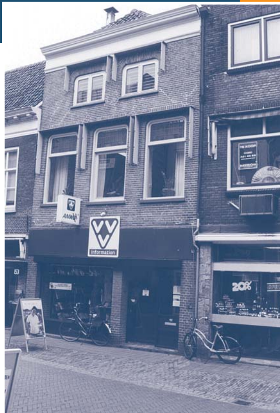
Oudestraat 151-1 te Kampen